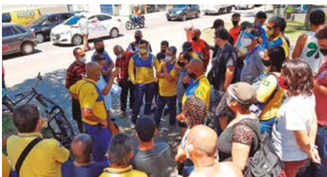
Sindicato mobiliza setores com alta de casos de COVID 19

O SINTECT-RJ está no caminho certo, continuará defendendo o isolamento social como medida efetiva para conter o avanço da covid-19, já que não existe ainda medicamentos ou vacinas eficazes para a doença.