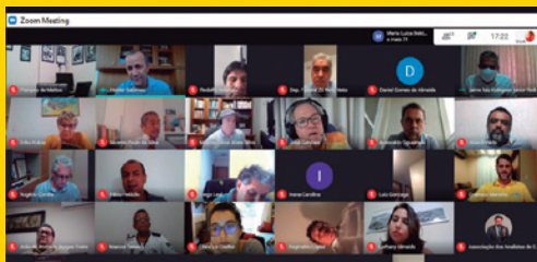
Reunião com as Frentes Parlamentares em Defesa dos Correios, em Defesa da Soberania em Defesa das Empresas Públicas, passo inicial para unir sindicatos e parlamentares na luta