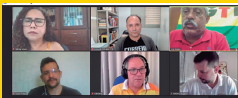
Reunião da CTB com estatais ameaçadas de privatização