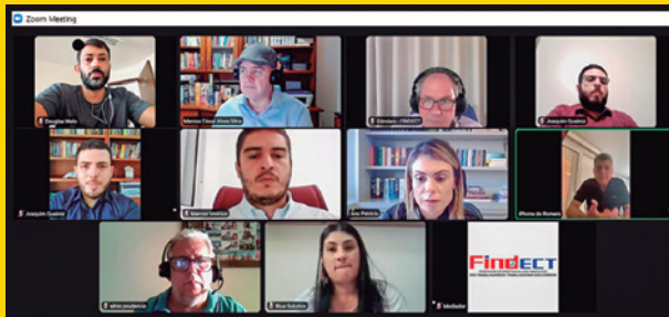
Reunião com assessoria do deputado Gervásio Maia, relator do PL na CCTCI