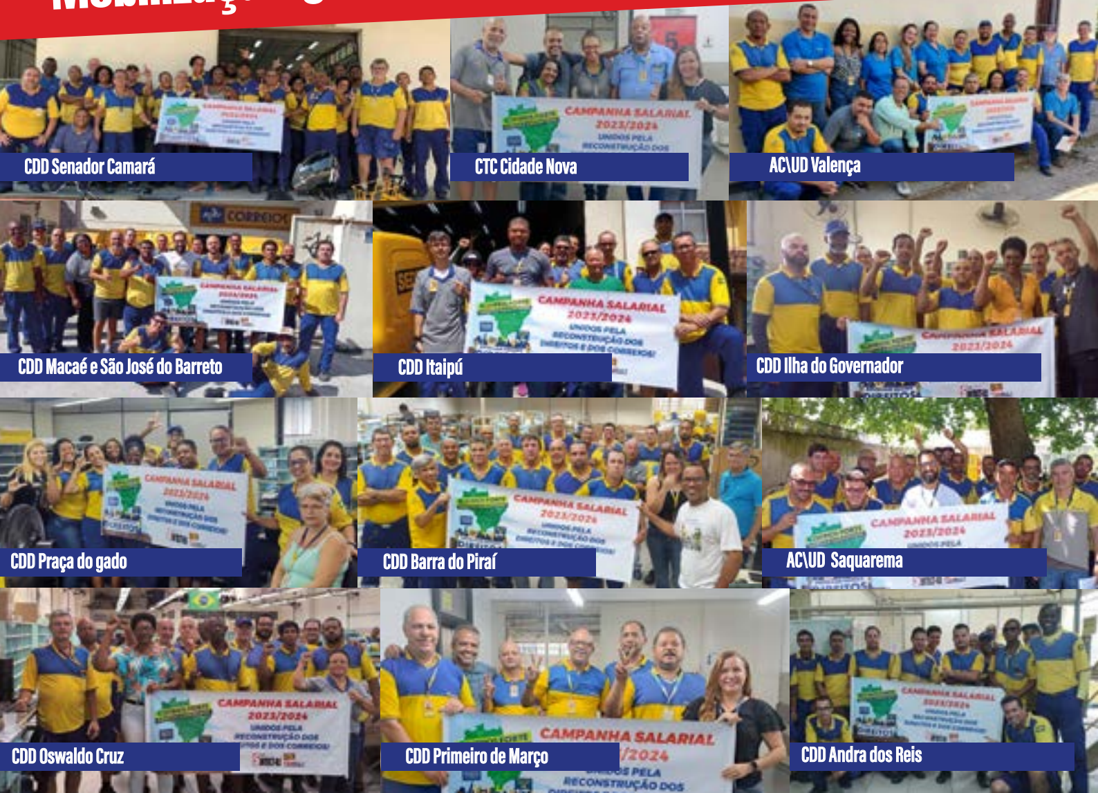
CDD Senador Camará